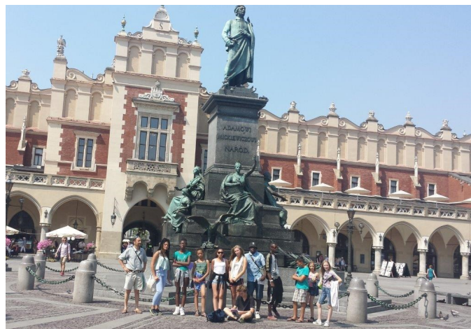
A la découverte de Cracovie.

Le spectacle qui a été joué le 15 août a regroupé 10 jeunes polonais, 15 jeunes allemands et 10 jeunes chantelouvais.