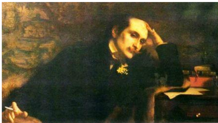
Edmond Rostand, écrivain français (Marseille 1868-Paris 1918). Débute par un recueil de vers ( les Musardises , 1890), avant de réussir au théâtre : Cyrano de Bergerac , 1897 ; l'Aiglon , 1900 ; Chanteclerc , 1910.