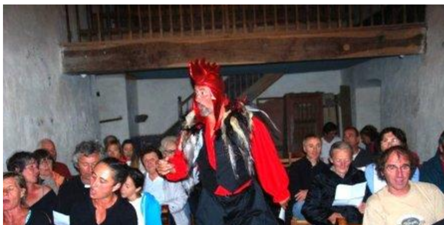
Récital à Lescun - juillet 2014